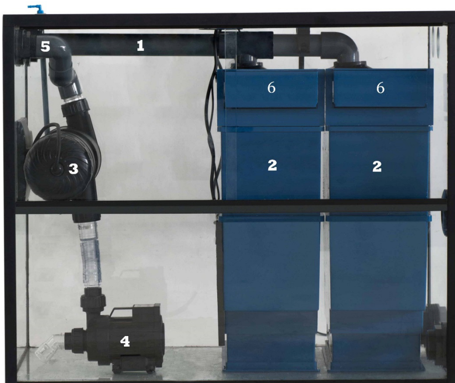
Abb. 1: Malawi Station

Abmessungen: 75,5 x 47,5 x 62 cm (L x B x H).