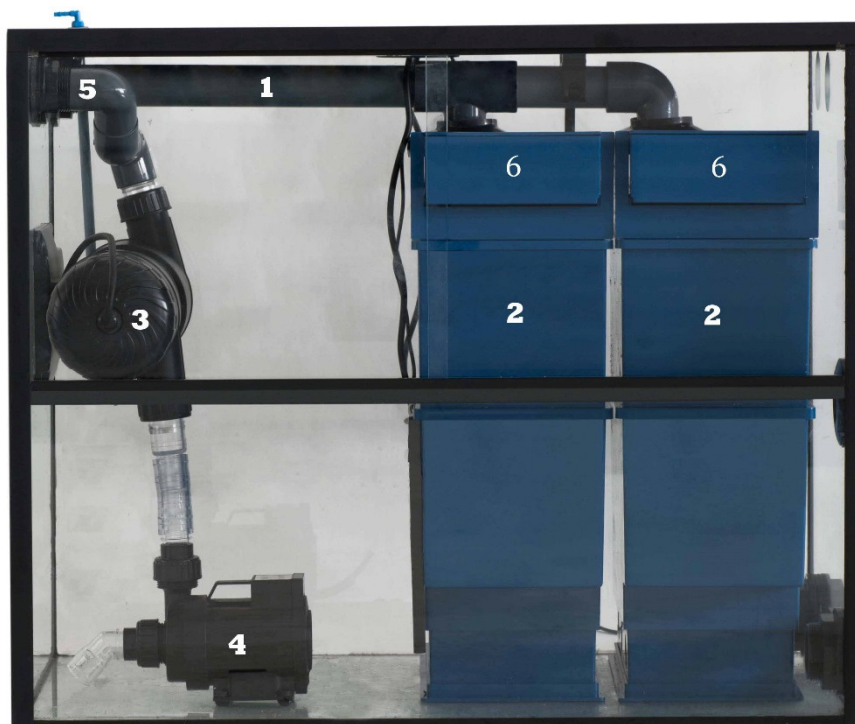
Schéma 1: Malawi Station

Dimensions: 75,5 x 47,5 x 62 cm (L x l x h).