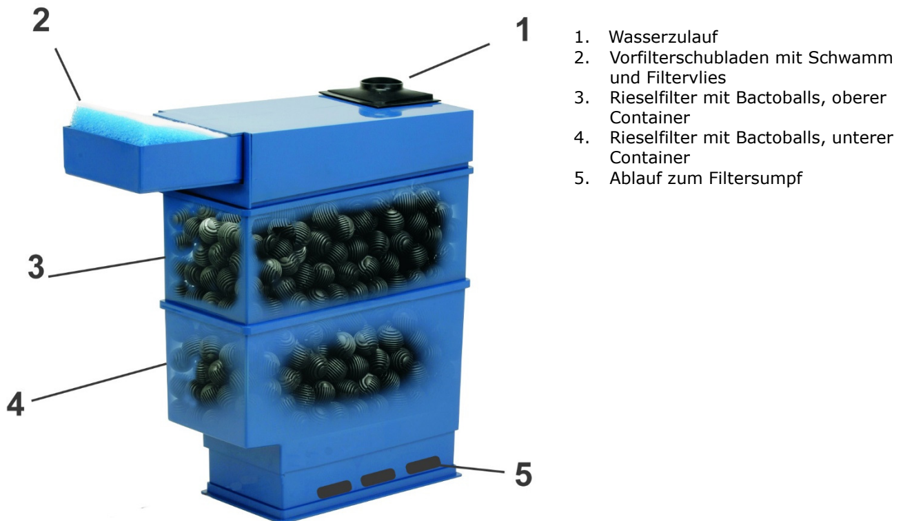
Abb. 2: Blue Tower